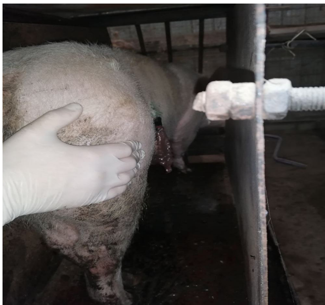
Рис. 3. Прооперированное животное в балансовой клетке с установленной канюлей и резиновым мешочком для сбора химуса

Илеальное содержимое отбирали в резиновые контейнеры, прикрепленные к фистуле. Содержимое илеума хранили в морозильной камере при -15 - 20^{\circ}\text{C} . В последующем образцы объединяли, гомогенизировали и отбирали для исследования аликвоты содержимого. В связи с тем, что переваримость сырого протеина изучалась илеальным традиционным методами (с применением инертного маркера – 0,5% (Оксид хрома (III), \text{Cr}_2\text{O}_3 ), входящего в состав всех опытных рационов), в учётный период проводили отбор пятипроцентных аликвот содержимого подвздошной кишки (СПК) и кала [9]. Свиньи с установленной канюлей и резиновыми мешочками для отбора химуса представлены на рисунке 3 и 4.