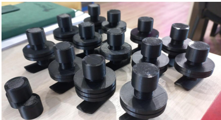
Рис. 1. Т-образная канюля для имплантации в подвздошный отдел кишечника

увлажняли, фиксировали их потребление. Животных кормили дважды в сутки, а воду предоставляли в объеме 3 литров на голову в сутки.