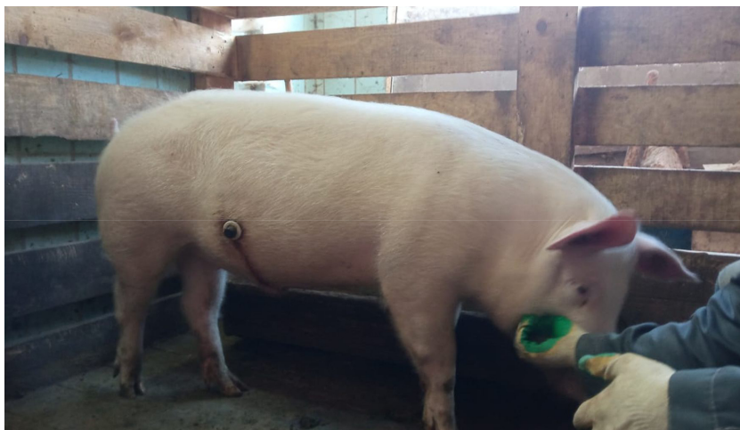
Рис. 4. Прооперированное животное в загоне в предбалансовый период

Кажущуюся фекальную (КФП) и илеальную переваримость (КИП) определяли путем вычитания из общего количества аминокислоты, попавшей в организм с кормом, того количества аминокислоты, которое было обнаружено в содержимом подвздошной кишки: по формуле: