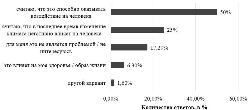
Рис. 2. Количество ответивших на вопрос: «Как Вы относитесь к изменению климата?»

Среди частных ответов можно привести такой обобщенный пример: «изменение климата носит естественный характер и поэтому оказывает естественное воздействие на все живые организмы».