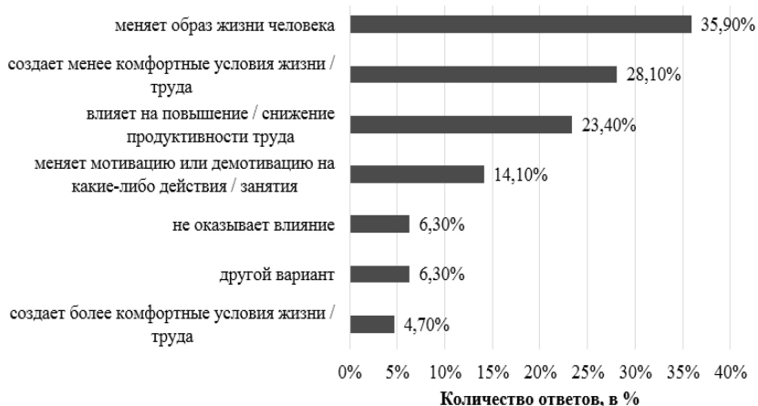
Рис. 3. Количество ответивших на вопрос: «Какое, на Ваш взгляд, влияние оказывает изменение климата на деятельность человека?»

При ответе на следующий вопрос, более 35% опрошенных считают, что изменение климата меняет образ жизни человека. Почти четверть (28,1%)