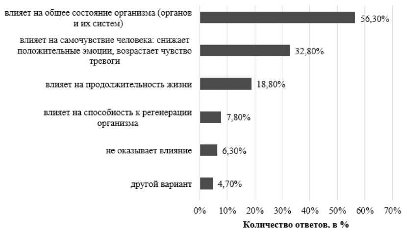
Рис. 4. Количество ответивших на вопрос: «Какое, на Ваш взгляд, влияние оказывает изменение климата на здоровье?»

Что касается проблем влияния климата на здоровье, то большинство опрошенных жителей Сахалинской области (более 80%) такую проблему так или иначе рассматривают. При этом, более половины (56,3%) полагают, что изменение климата влияет на общее состояние и функционирование организма, а треть (32,8%) считают, что в целом влияет на их самочувствие (рис. 4).