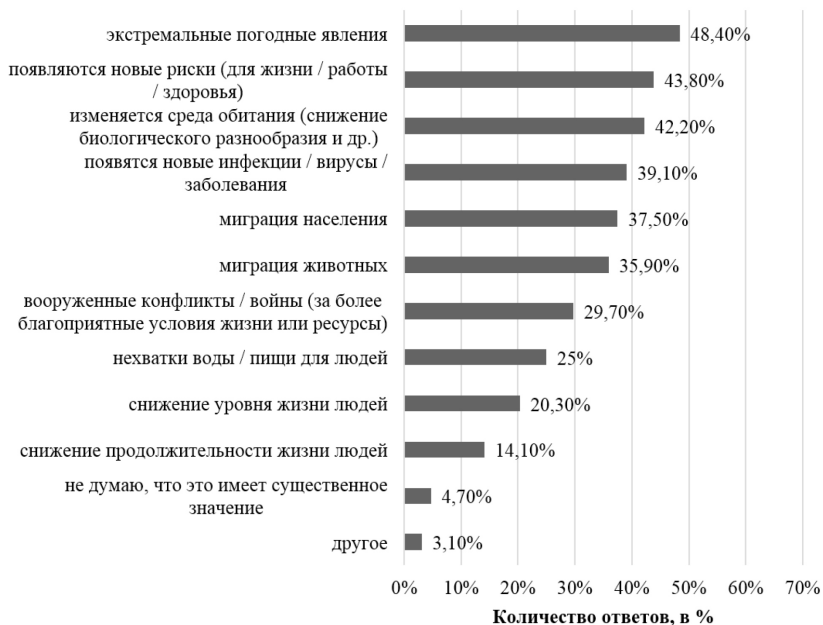
Рис. 5. Количество ответивших на вопрос: «Какие из событий могут произойти вследствие изменения климата?»

Компонентный анализ вероятных негативных событий, с которыми связывает население изменение климата распределил такие события следующим образом: на первом месте – это экстремальные погодные явления (так ответила почти половина респондентов – 48,4%), далее – это новые риски для жизни или работы (43,8%), изменение среды обитания (42,2%), появление новых вирусов и заболеваний (39,1%). При этом, считающих эту проблему незначительной – всего менее 5% (рис. 5).