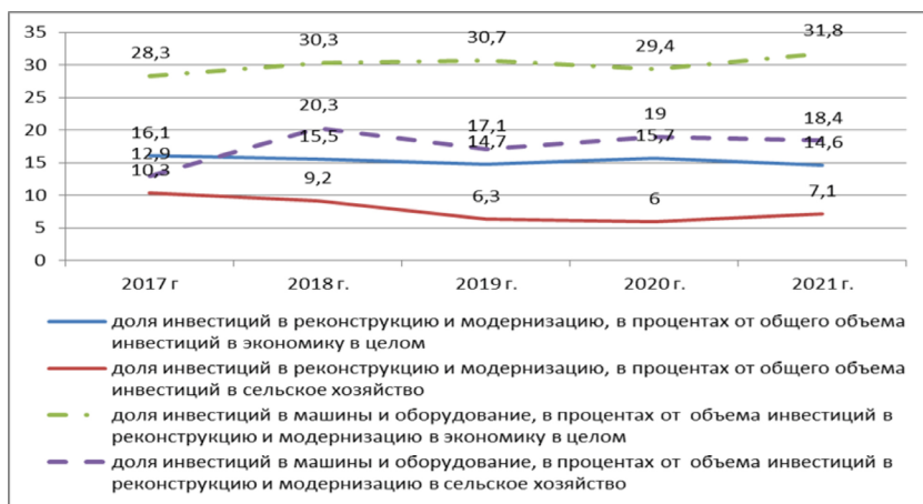
Рис. 1. Часть инвестиций, выделенных на реконструкцию и модернизацию основных фондов по РФ, % от общего объема инвестиций Составлено по данным [3, 4]

Только десятая часть аграрных предприятий проводит мероприятия по технологическим инновациям. При этом часть инвестиций, которые предприятия направляют на реконструкцию и модернизацию основных фондов сельского хозяйства, составила в 2021 г. только 7,1%, вдвое меньше, чем по экономике в целом (рисунок 1). При этом их технологическая структура несовершенна, так как удельный вес затрат в активную часть основных средств всего 18,4%, тогда как по экономике в целом 31,8%.